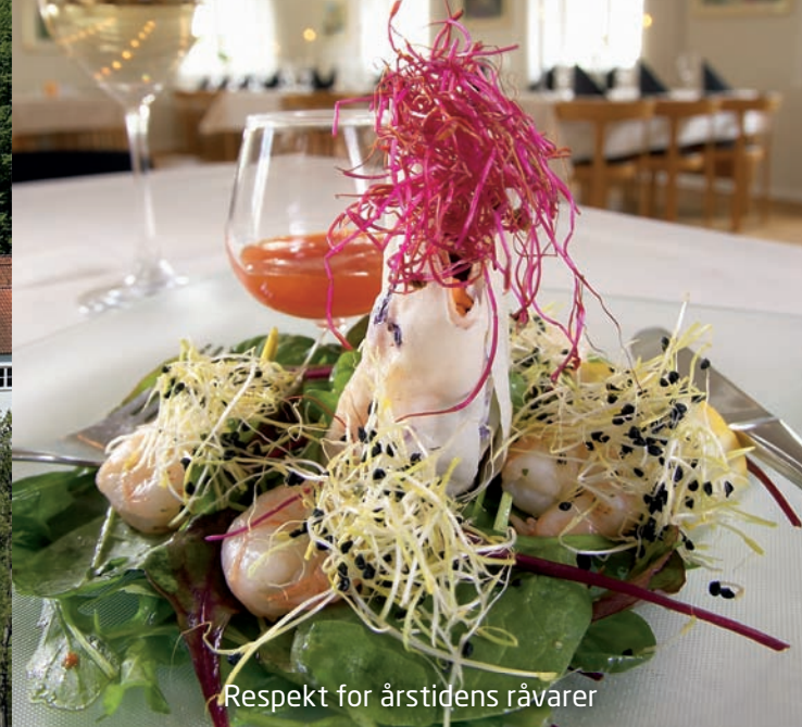
Respekt for årstidens råvarer