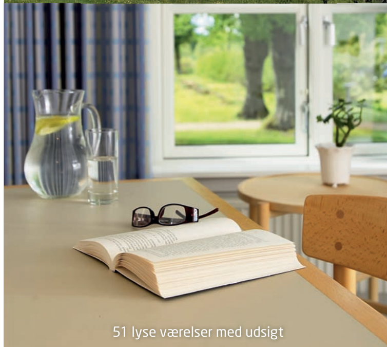
51 lyse værelser med udsigt