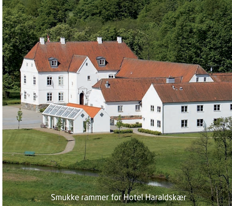
Smukke rammer for Hotel Haraldskær

Der er mange minder udover festen at tage med sig hjem. Stedets historie er et kapitel for sig, som også er værd at udforske nærmere, inden dine gæster siger farvel og tak. Og hvad enten de skal syd- eller nordpå, ligger Hotel Haraldskær kun 10 km fra motorvejen og med 7 km til Vejle Banegård.