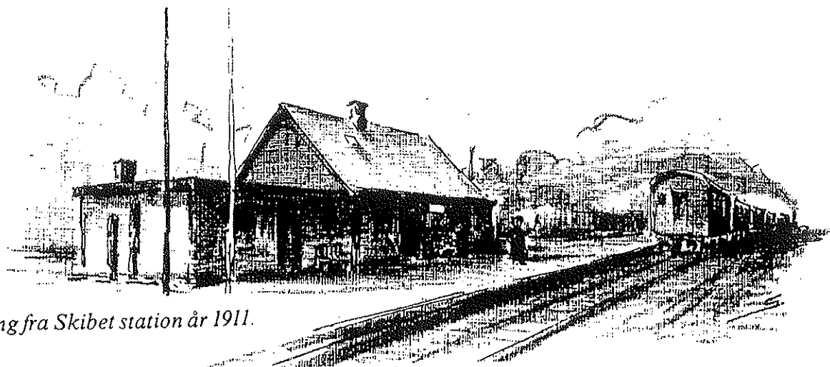
Togafgang fra Skibet station år 1911.